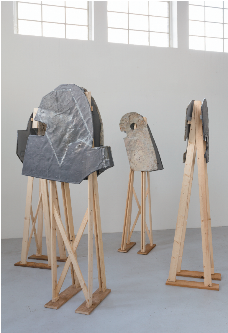
„Ich schäle mich aus deinem Wort“ 2020