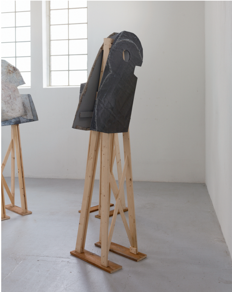
„Ich schäle mich aus deinem Wort“ 2020